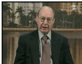
Edgard MITCHELL (Apollo 14)

Passando ad intervistare Edgard MITCHELL, la conduttrice ha chiesto all'ex-astronauta perché la NASA tenga nascosti i documenti sugli UFO. In proposito Edgard MITCHELL ha voluto subito precisare la sua posizione a riguardo, sottolineando di voler parlare soltanto della sua esperienza personale e di non essere a conoscenza di documenti UFO nascosti dalla NASA.